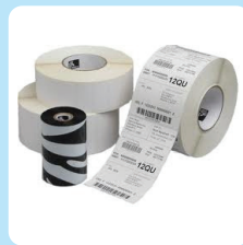
Consumables (labels, ribbons, PVC cards)