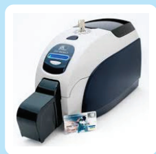
PVC card printers